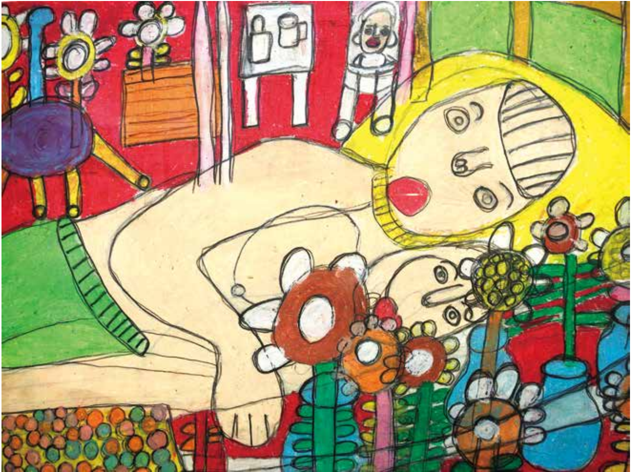
絵:「母と子」高橋孝充 (当日、体育館に展示します)

2023 10.1 (日) inしあわせの村 10:00 ~ 15:00 (中央緑道・芝生広場・体育館)